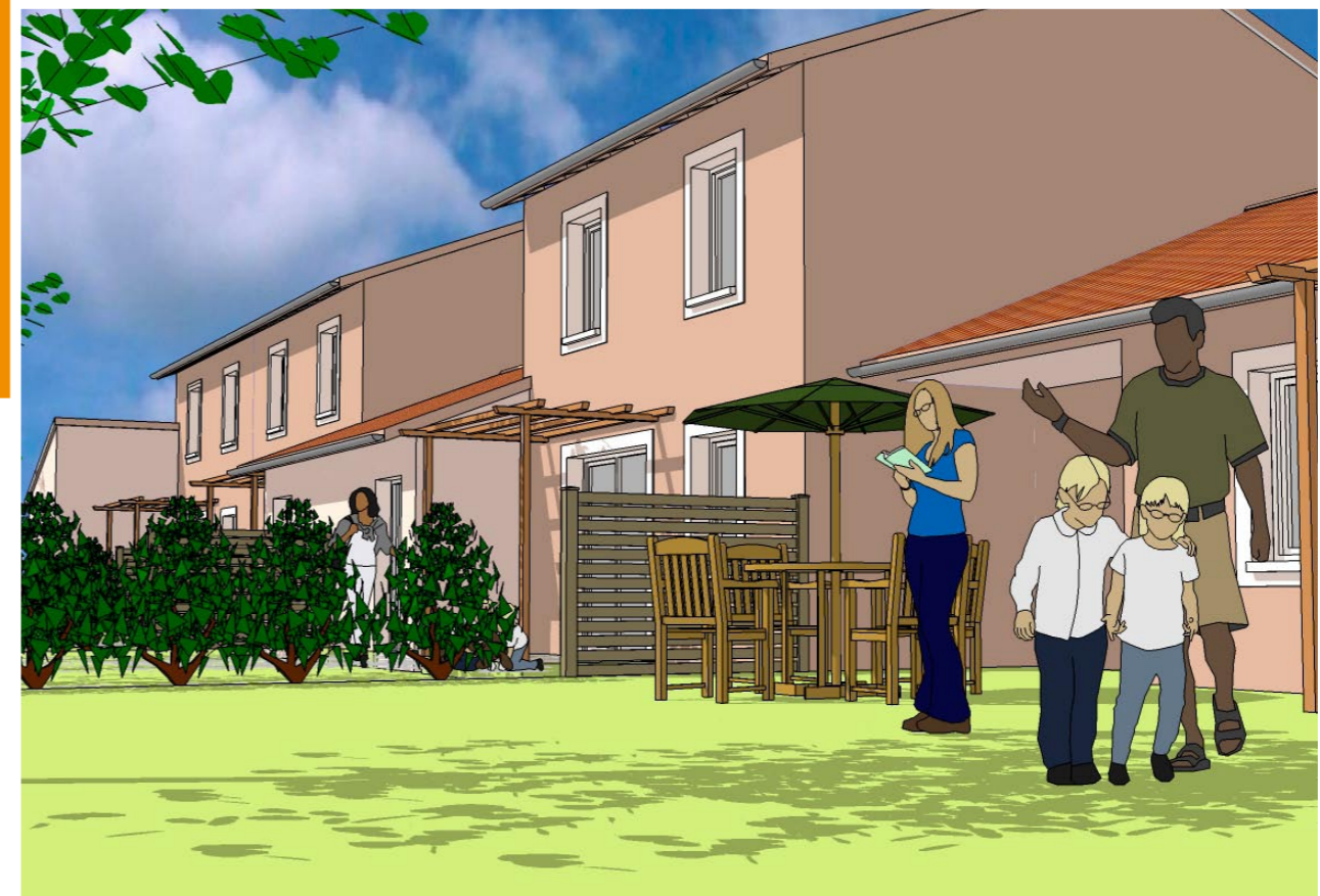
POSE DE LA PREMIÈRE PIERRE DES 16 LOGEMENTS LOCATIFS DU LOTISSEMENT LE GRAND CLOS SAINT JEAN LE PRICHE