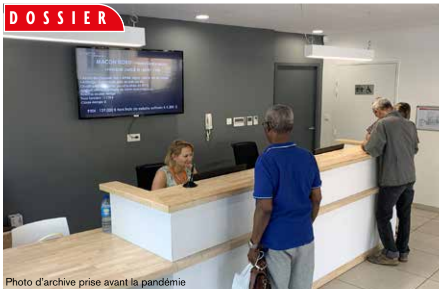
Photo d'archive prise avant la pandémie